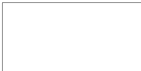
図 1 図の説明 (9pt)