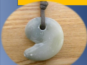
C 体験教室 -まが玉づくり-