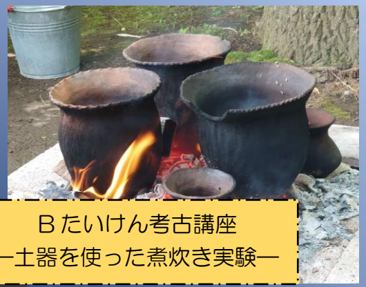
B たいけん考古講座 —土器を使った煮炊き実験—